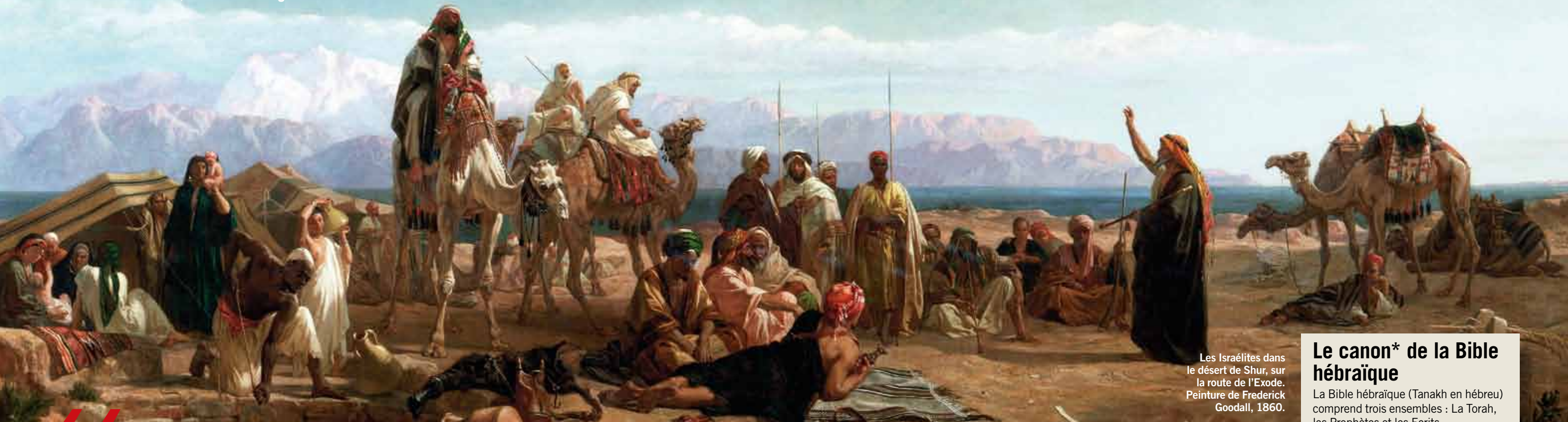
Les Israélites dans le désert de Shur, sur la route de l'Exode. Peinture de Frederick Goodall, 1860.