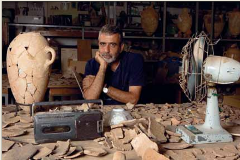
Israël Finkelstein à Megiddo : « Vouloir résoudre un problème, c'est plonger en son cœur. »

Dans les années 1970, le jeune archéologue sillonne le Sinaï et le désert du Néguev. Il publie d'importants articles sur ces régions arides à l'âge du fer et à l'âge du bronze. Un ouvrage récapitulatif de ces travaux, Living on the Fringe , paraît en Angleterre. « Ce livre, qui n'a pas été traduit en français, permettait de comprendre les processus de nomadisation et de sédentarisation », précise-t-il. Dans les années 1980, Israël Finkelstein effectue des fouilles archéologiques dans les collines centrales. Il travaille à Silo, un des hauts lieux bibliques. C'est au cours de ces travaux, alors qu'il fait des recherches sur les Proto-Israélites, qu'il comprend que ceux-ci ne sont pas arrivés « de la Lune », mais qu'ils se sont développés localement à partir de populations autochtones. Les Israélites ne sont ni plus ni moins que des Cananéens. Ceux qui porteront plus tard le nom d'Hébreux. Un nom probablement issu de l'akkadien Apirou , qualificatif plus social qu'ethnique, désignant, au départ au moins, une partie des habitants des marges des zones montagneuses.