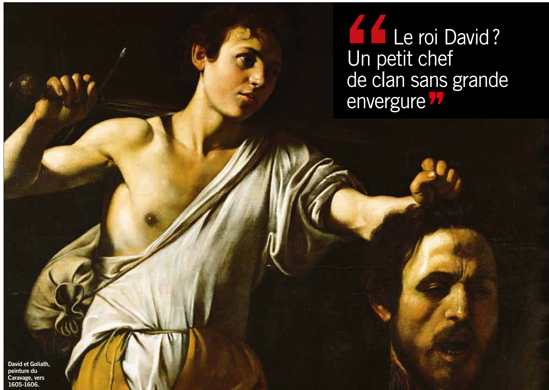
David et Goliath, peinture du Caravage, vers 1605-1606.

C'est une grande question. Si nombre de ces écrits sont déjà rassemblés au moment de la destruction de Jérusalem et de son temple en 587 avant J.-C., beaucoup ont certainement été composés entre le ●●●