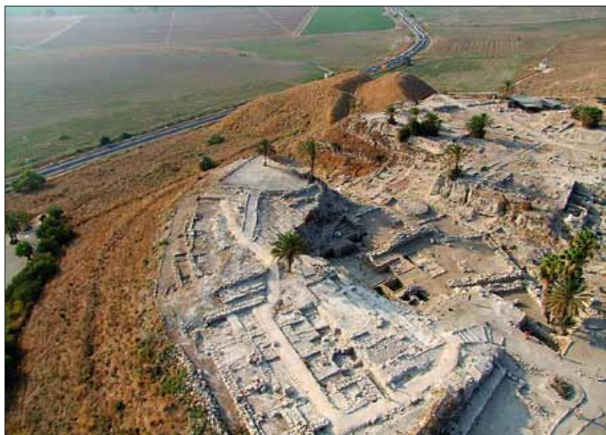
Empilement d'une trentaine de cités, Megiddo a été occupé du 7 e millénaire au 5 e siècle avant J.-C.

éléments majeurs. Au début du 20 e siècle, elle est la cité où sont « retrouvées » les portes monumentales du roi Salomon. Décrit dans la Bible, ce puissant monarque est devenu l'archétype occidental du roi juste et équitable. Mais elle est surtout identifiée comme l'Armageddon (de l'hébreu Har-Megiddo , mont Megiddo) de l'Apocalypse, dernier livre du Nouveau Testament, c'est-à-dire le lieu où, à la fin des temps, doit se dérouler la bataille ultime entre le Bien et le Mal. Elle est un lieu d'attente eschatologique et messianique pour des centaines de millions de croyants dans le monde. Si symbolique même qu'en 1964, elle est choisie pour accueillir Paul VI lors du premier voyage effectué par un pape au pays de la Bible depuis le début de la chrétienté! C'est au milieu du 19 e siècle que les ruines du tel sont identifiées par le pasteur améri-