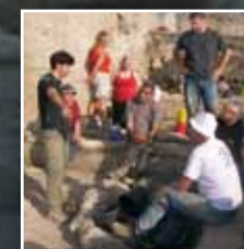
Visite de Megiddo, haut lieu de l'archéologie biblique. p. 50