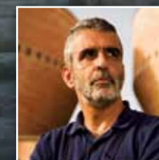
Rencontre avec Israël Finkelstein, l'auteur de « la Bible dévoilée ». p. 56